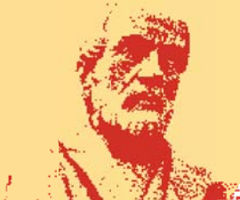
Capitale e Lavoro nelle stesse mani Giuseppe Mazzini